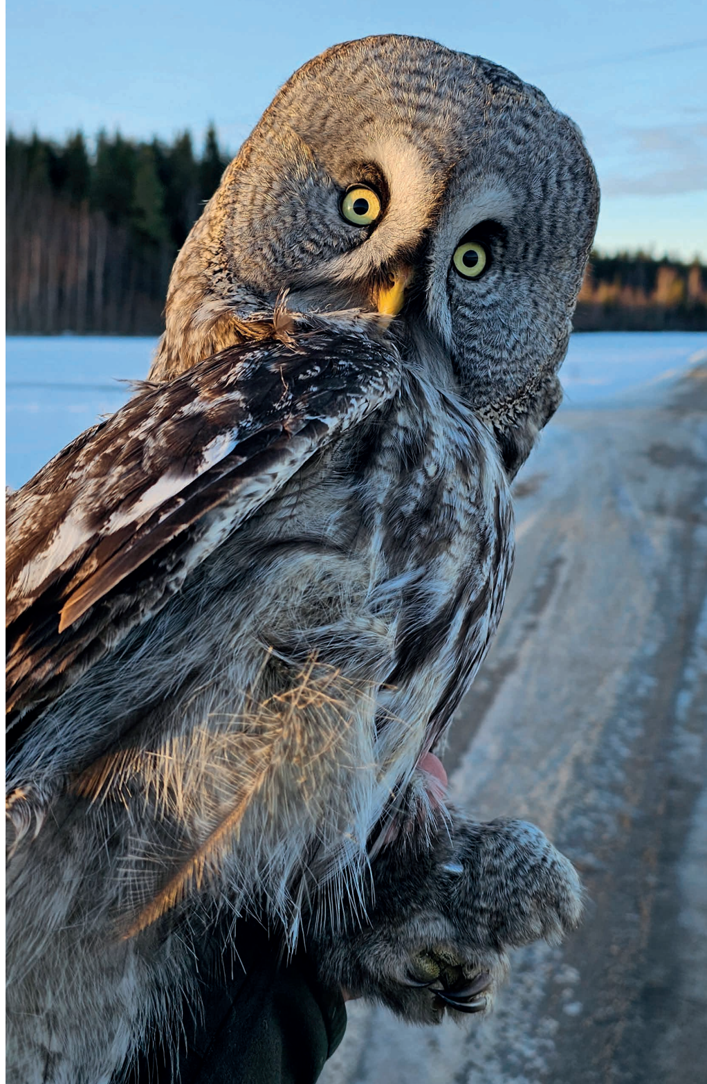
Abb. 6: Weiblicher Bartkauz Strix nebulosa lapponica/Strix barbata. Kauhava, Finnland, 09.03.2024.

Auf der Grundlage dieser stimmlichen Details kamen diese Autoren bereits 2015 zu dem Schluss, dass zwischen zwei Arten und nicht zwischen zwei Unterarten zu differenzieren sei. Leider benutzten sie den Trivialnamen „Lapland Owl“ (Lapplandeule) für die eurasische Art, da wohl der historische wissenschaftliche Begriff Strix barbata nicht bekannt war. Deshalb habe ich in den zitierten Lautbeschreibungen den Begriff „Bartkauz“ anstelle von „Lapplandeule“ verwendet.