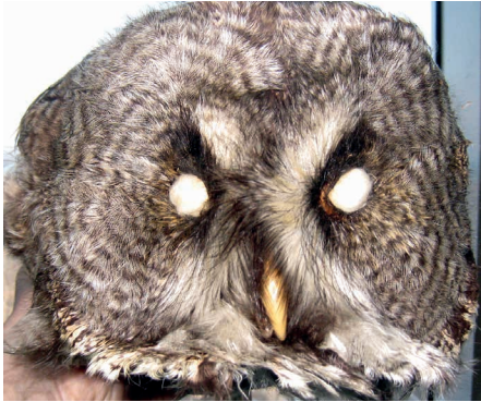
Abb. 7: Gesichtsmaske eines Bartkauz' Strix nebulosa lapponica/Strix barbata . Bolshoy Shantar-Insel, Ochotskisches Meer, Russland. Das Objekt stammt aus dem Jahr 1978 von V. G. YUDIN (Sammlung des Instituts für Biologie und Bodenkunde, Wladiwostok).

Vielleicht wurde die erste Bartkauzabbildung von der Natur selbst auf der Oberfläche einer uralten Kiefer in Finnland „geschaffen“ (Abb. 9). Die Altersbestimmung der Kiefer wurde nicht durchgeführt, aber wahrscheinlich ist sie viel älter als JOHN LATHAM's Beschreibung von 1790. Die Gesichtsringe (9+) sind in diesem natürlichen und von Menschhand belassenen Kunstwerk gut zu erkennen. Heute ist dieser alte Baum einer der Hauptpfeiler des Vogelbeobachtungsturms auf der Insel Hailuoto bei Oulu, Finnland.