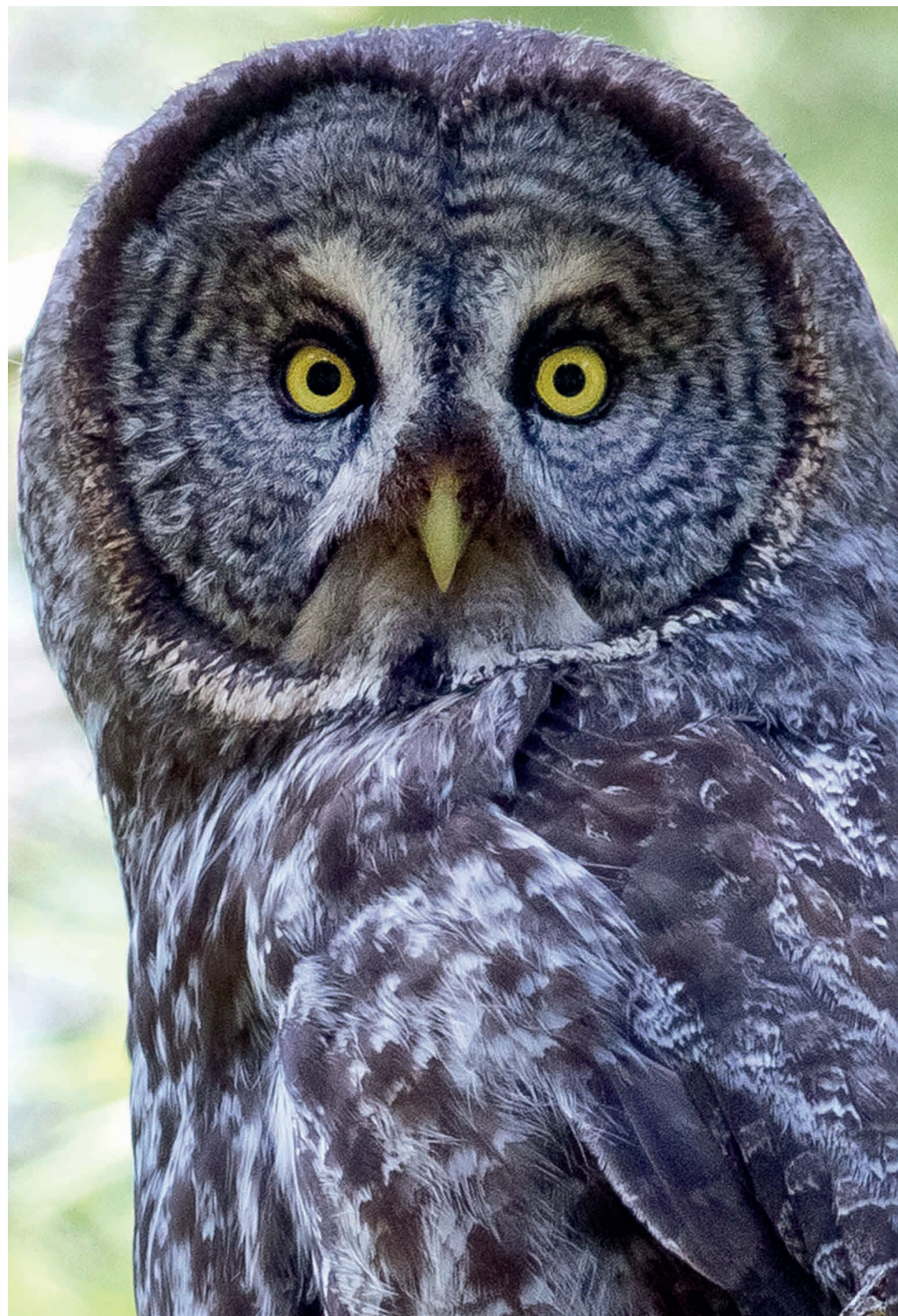
Abb. 3: Weiblicher Bartkauz Strix nebulosa yosemitensis mit 5-6 (!) Gesichtsringen. Sierra Nevada, Kalifornien, 31.05.2012.

Sämtliche Nestfunde dieser Eulenart wurden aus den Jahrbüchern des BirdLife Finnland von 2008 bis 2024 gesammelt. Die Gesamtzahl der Nester beträgt 1269 und es ist klar, dass diese Eule hauptsächlich in Mittelfinnland, Savonia, Häme und Nordkarelien brütet (über 63%). Lediglich 1,65% der Nester wurden in Lappland gefunden, was noch weniger ist als im südlichsten Bundesland Kymenlaakso (2,29%). Und in Lappland gibt es sogar oft