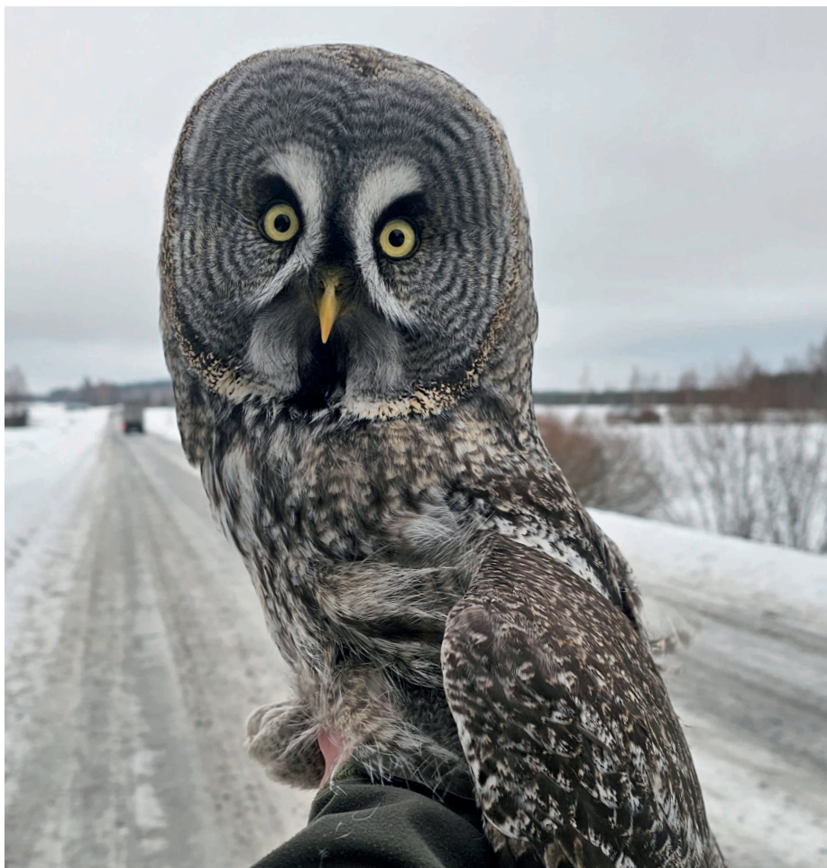
Abb. 5: Nicht alle Eulenarten haben einen so ausgeprägten Gesichtsschleier wie dieser männliche Bartkauz Strix nebulosa lapponica / Strix barbata mit 8 Gesichtsringen. Lapua, Finnland, 23.2.2024.