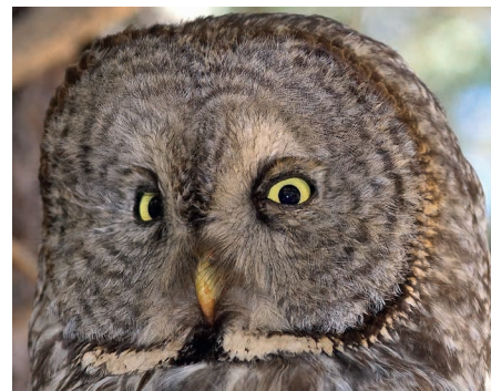
Abb. 4: Männlicher Bartkauz Strix nebulosa yosemitensis mit nicht mehr Gesichtsringen als beim weiblichen. Sierra Nevada, Kalifornien, 02.09.2007.