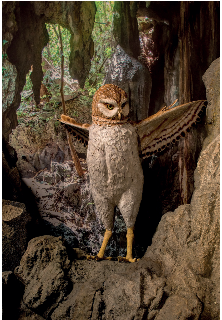
Abb. 7: 99 cm großes Modell der Gattung Ornimegalonyx (Präparatorsleitung: JASON BROUGHAM, American Museum of Natural History, New York City. Foto: Giant Owl_DF - credit DENIS FINNIN/© American Museum of Natural History AMNH).

ARREDONDO schätzte die Größe von Ornimegalonyx oteroi auf 1,1 m (Abb. 6. ARREDONDO 1972a, 1972b, 1976) und das Gewicht auf bis zu 30 kg, wobei spätere Studien dies auf ein wahrscheinlicheres Gewicht von