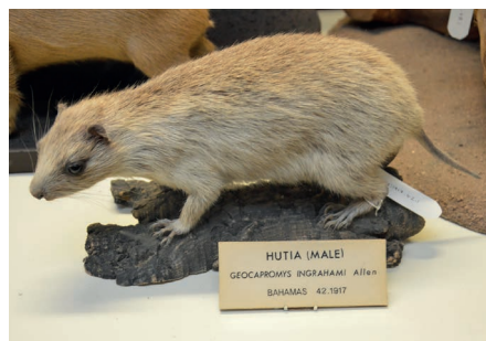
Abb. 4: Präparat der Bahama-Baumratte Geocapromys ingrahami (National Museum of Ireland – Natural History, Dublin. Foto: https://en.wikipedia.org/wiki/Bahamian_hutia . Creative Commons Attribution - Share Alike 4.0).

Aus der Untersuchung der drei Fragmente eines einzelnen Laufknochens (Tarsometatarsus) und des distalen Endes eines rechten Speichenknochens (Radius; Abb. 1) schloss WETMORE, dass es sich um die Überreste einer Rieseneule der Gattung Tyto handelte und gab ihr den Namen Tyto ostologa . WETMORE und SWALES verglichen die Maße der ausgegrabenen Ex-