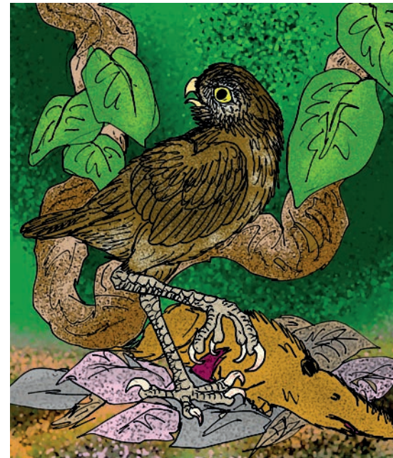
Abb. 5: Rekonstruktion der ausgestorbenen Kuba-Rieseneule Ornimegalonyx oteroi (Grafik: STANTON F. FINK, Wikki Commons - Creative Commons Attribution - Share Alike 4.0).

Ursprünglich als zwei neue Arten der Gattung Tyto veröffentlicht, wurde nach einer Überarbeitung des Typusmaterials von Tyto riveroi und Tyto neddi empfohlen, T. riveroi von Kuba (ARREDONDO 1972b) als subjektives Synonym von T. pollens der Bahamas (WETMORE 1937) zu behandeln. Dasselbe gilt für T. neddi von Barbuda und den Kleinen Antillen (STEADMAN & HILGARTNER 1999), das ebenso als subjektives Synonym von T. noeli von Kuba (ARREDONDO 1972a) zu betrachten ist (SUÁREZ & OLSEN 2015).