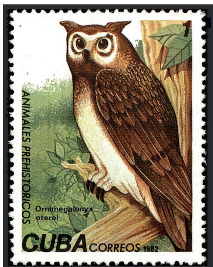
Abb. 9: Postwertzeichen der kubanischen Postverwaltung mit einer Rekonstruktion von Ornimegalonyx oteroi , 15.09.1982.

Untersuchungen von fossilem Material aus zahlreichen Höhlen in ganz Kuba haben den außerordentlichen Reichtum an endemischen Säugetieren gezeigt, der Ornimegalonyx in dieser Zeit als Beute zur