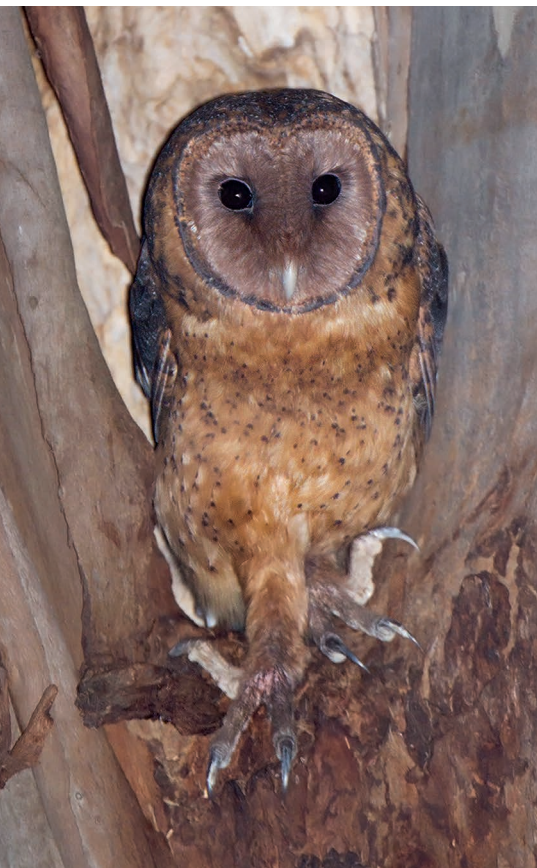
Abb. 3: Tasmanienschleiereule Tyto castanops.

( Aepyornis und Mullerornis ) zu nennen. Diese waren vermutlich flugunfähig im Gegensatz zu den Vorfahren der heutigen Greifvögel und Eulen. Auch wenn sie nicht die enorme Größe dieser terrestrischen Vogelgruppen erreichten, so waren doch eine Reihe von Greifvögeln des Pleistozäns ein Vielfaches größer als ihre heutigen Gegenstücke – dies gilt auch für den Vergleich der fossilen und rezenten Eulenarten. In Anlehnung an den Sammelbegriff Megafauna für die riesigen Tiere des Pleistozäns prägen wir hier den Begriff „Megastriges“, um allgemein auf den Gigantismus bei Eulen hinzuweisen, obwohl der Begriff nicht für ein systematisches Taxon stehen soll. Diese ausgestorbenen Rieseneulen gehörten sowohl zu der Familie der Tytonidae als auch zu den Strigidae, wobei die überwiegende Mehrheit auf den karibischen Inseln entdeckt wurde. Die Evolution großer Körpergrößen bei Arten, die auf Inseln isoliert leben, wird im Allgemeinen als insularer Gigantismus bezeichnet und ist auf eine Reihe von Selektionsfaktoren zurückzuführen, wie z. B. das Fehlen wichtiger Prädatoren sowie die leichte Verfügbarkeit von eigener Beute (LOMOLINO 2005). 1