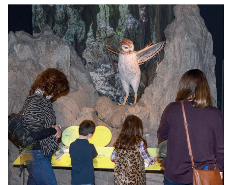
Abb. 8: Das Modell aus Abb. 7 im Größenvergleich zu Museumsbesuchern.

9-13,5 kg korrigierten. Wie bei den rezenten Eulen und Greifvögeln gab es auch bei Ornimegalonyx einen Reversen Sexualdimorphismus RSD, bei dem die Weibchen einer Art größer sind als die Männchen. Ornimegalonyx hatte sehr lange und kräftige Beine und große, kräftige Füße, was die Theorie stützt, dass sie extrem starke Läufer waren. Daher wird auch der englische Trivialname „Cursorial Owl“ (etwa: