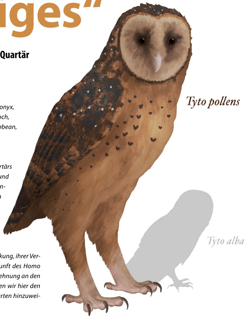
Abb. 2: Rekonstruktion der ausgestorbenen Bahama-Riesenschleiereule Tyto pollens. Im Größenvergleich: die rezente Schleiereule Tyto alba. Die Wahl der dunklen Gefiederfärbung beruht auf der Annahme für eine Tarnungsmöglichkeit.