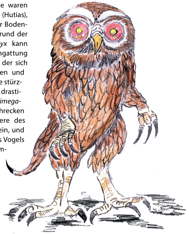
Abb. 10: Das angebliche Unwesen Chickcharney der Inselgruppe Andros, Bahamaarchipel (Rekonstruktion: GEORG BINDER).

Chickcharneys bis in die Gegenwart gehalten. Zum Nestbau würden sie angeblich mehrere Kiefern zusammenbinden und in deren Mitte ein Nest errichten. Nach bahamaischem Volksglauben sind mehrere dieser Baumformationen gesichtet worden.