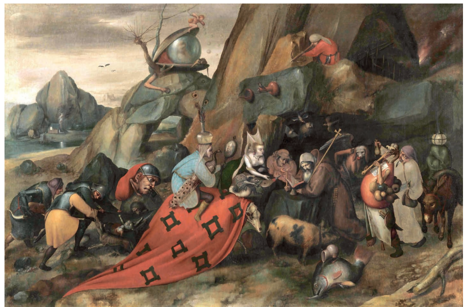
Abb. 14: PIETER BRUEGEL DER ÄLTERE, Nachfolger, Versuchung des Hl. Antonius . Ölgemälde, zweite Hälfte 16. Jh. (Roma, Galleria Colonna).

Im Gemälde ist weiters zwischen dem Armbrustmotiv und dem Heiligen eine Anhaszscene eingefügt, 80 die keinen erotischen Hintergrund hat. Sie steht sinnbildhaft für das Bedrängtsein, ähnlich dem Heiligen darunter, der ebenfalls von