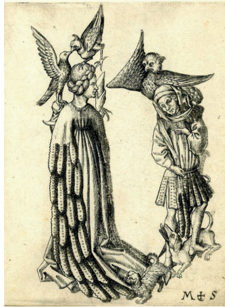
Abb. 1: Meister E.S., Der Buchstabe b . Kupferstich, zweites Drittel 15. Jh. (London, British Museum. 1858,0417.937. Shared under a Creative Commons Attribution-NonCommercial-ShareAlike 4.0 International [CC BY-NC-SA 4.0]).

In der niederländischen Lyrik des frühen 16. Jahrhunderts findet sich eine bereits entwickeltere Variante vom Aufhauben, da nun der Zeit und den Um-