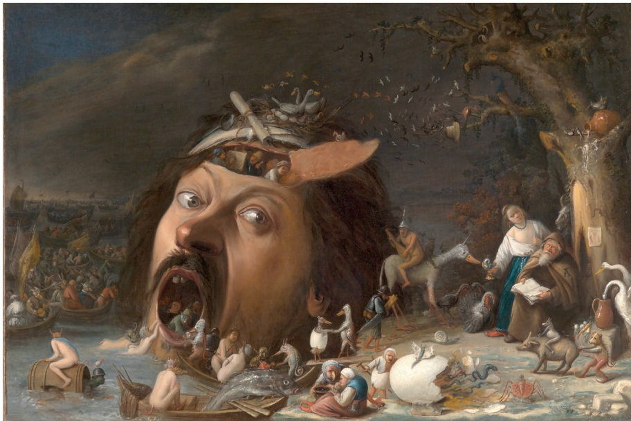
Abb. 15: JOOS VAN CRAESBECK, Die Versuchung des Hl. Antonius . Öl auf Leinwand, um 1650 (Karlsruhe, Staatliche Kunsthalle, 2764).