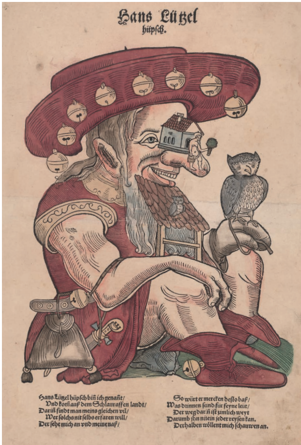
Abb. 3: Hans Lützel hüpsch aus dem Schlaraffenland. Holzschnitt, um 1520 (Gotha, Schlossmuseum Schloss Friedenstein, Kupferstichsammlung, 40.19).

die auf einer Leiter sitzend einem alten Lüstling zuschaut, wie er einer jungen Frau lustvoll an Gesicht und Brust greift. 17 Der unter dem Tisch stehende große Krug erinnert wiederum an das Symbol für den Uterus.