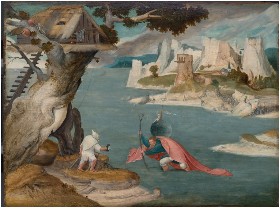
Abb. 13: PSEUDO JAN WELLEMS DE COCK, Der Hl. Christophorus mit dem Christkind . Öl auf Holz, um 1520/25 (Amsterdam, Rijksmuseum, SK-C-1840).