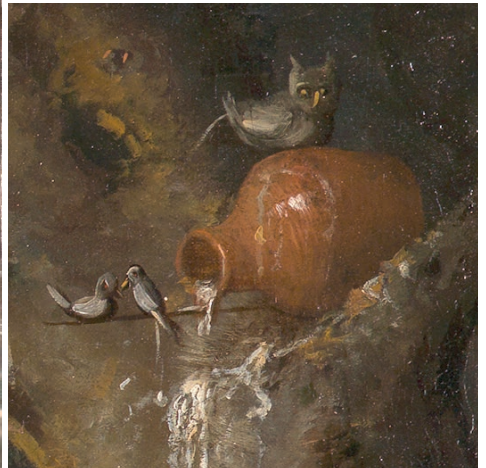
Detail aus Abb. 15

Krug heraus und zur Rechten eine Stange mit einer Eule, die von zwei Vögeln umflogen wird. Die Analogien in der Komposition der beiden Bilddetails bei BOSCH und VAN DER HEYDEN zeigen nun klar, dass das Gefäß an der Stange auf dem Heuwagen ein Nisttopf ist. Der ältere Mann darunter ist eine Anspielung auf das Alter. Eule (Vogel=Phallus) und Vogeltopf (Uterus) sind Teil der sexuellen Metapher, die uns in dem Bild von VAN CLEVE begegnet.