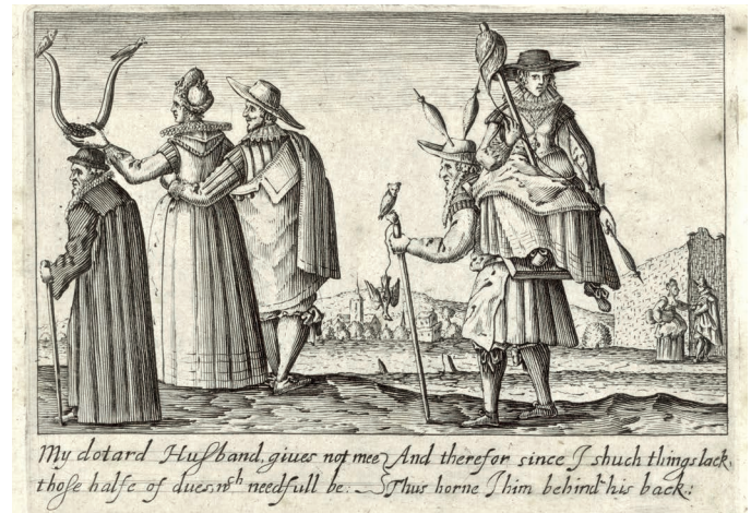
Abb. 10: Alter Mann und junge Frau. Radierung, 1628 (Washington, Folger Shakespeare Library, STC 10408.6; ESTC S125383).

Zur Rechten trägt ein Greis seine Frau auf einer Tragekraxe am Rücken. 45 Sie ist mit dem Auffädeln der Spindel beschäftigt, der Mann hat zwei Spindeln als Hörner