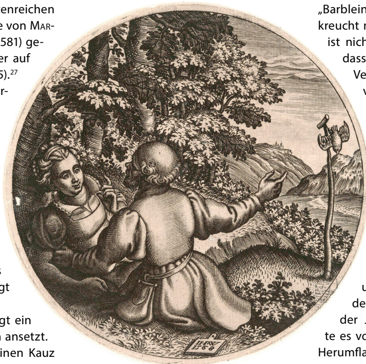
Abb. 7: JOHANNES WIERIX, Der alte Vogelfänger. Kupferstich, 1568.

bei unwillkürlich auf die Nisttopf-Uterus-Symbolik. 31 Zur Mitte des 17. Jahrhunderts hin fertigte einer der größten Drucker und Grafikhändler Amsterdams CLEMENT DE JONGHE (Brunsbüttel um 1624/25-Amsterdam 1677) einen seitenverkehrten Nachdruck des Sujets von VAN CLEVE an und versah ihn mit einem Spruch. 32