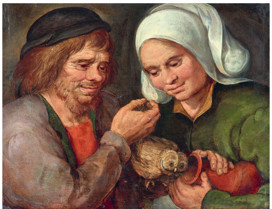
Abb. 5: MARTEN VAN CLEVE DER ÄLTERE, Bauer und Bäuerin mit Krug und Eule. Öl auf Holz, um 1570 (© Kunsthaus Lempertz, Köln).

Dass man sich im Alter beim „Vögeln“ mit dem begnügen muss, was man hat, wird auch auf einem niederländischen Kupferstich von CLAES JANSZ VISSCHER (Amsterdam 1587-1652) illustriert. Dabei wird das bekannte Sprichwort „Beter met den uil gezeten dan met de valk gevlogen“ in einem neuen, erotischen Sinne präsentiert. 24 Das Blatt zeigt ein älteres Bauernpaar auf einer Bank sitzend, während die Frau auf einem langen Blasinstrument bläst, das der Mann ihr reicht. Neben ihm sitzt eine Eule auf der Lehne und schaut den beiden zu. 25 Eine weitere Darstellung mit einem