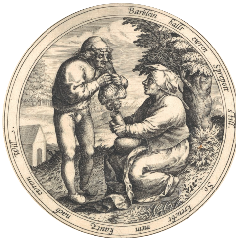
Abb. 6: Flämische Redensarten. Kupferstich, um 1560/80 (Amsterdam, Rijksmuseum, RP-P-2001-6).