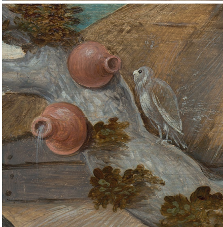
Detail aus Abb. 13

äugt (Abb. 13), so sind dies Elemente der bekannten Metapher von „Vogel“ und „Vogeltopf“. 75