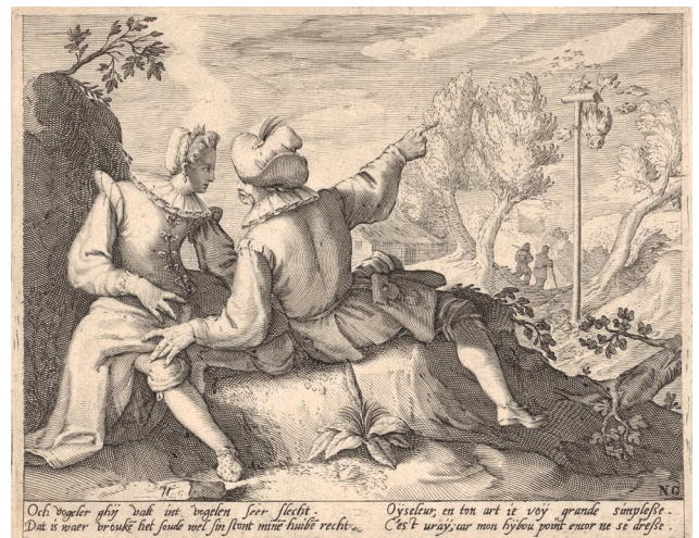
Abb. 8: PIETER DE JODE, Vogelfänger und Frau. Kupferstich, um 1590-1623 (Amsterdam, Rijksmuseum, RP-P-BI-4813).

cken | Way Truy hout uwen spreupot dan stille: siet / Oft ghy crycht den huben naer u wille; niet.“ Nicht nur aus der Inschrift geht nun klar hervor, dass es sich bei dem Krug um einen Nisttopf handelt. Das dargestellte Gefäß hat am oberen Rand die typische Lasche mit Loch, in das die Sitzstange gesteckt wurde. Bereits um 1560/80 entstand ein Neudruck des Sujets 33 in einer Serie von 12 Medaillons mit zweideutigen Redensarten und Sprüchen zumeist erotischen Inhalts (Abb. 6). 34 Die Umschrift benennt den „spreupott“, dargestellt ist ein einfacher Krug. Der Sinnspruch lautet nun „Barblein halt ewren spretpott still, so kreucht mein kautz nach ewrem will“. Es ist nicht nur dem Stich zu verdanken, dass diese Darstellung eine große Verbreitung erfuhr. 35 Diese Serien volkstümlicher Sprüche dienten auch als Verzierung für bemalte Speiseteller, die in den Niederlanden in der zweiten Hälfte des 16. Jahrhunderts sehr beliebt waren. 36