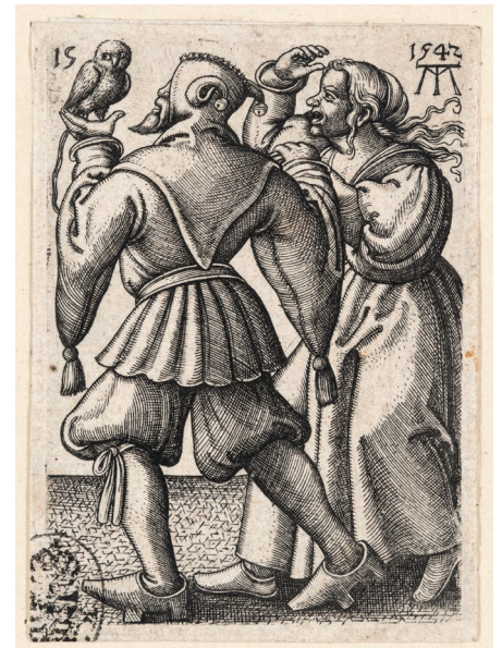
Abb. 4: MARTIN TREU, Bäuerin und Bauer mit Eule. Kupferstich, 1542 (© Dresden, Kupferstichkabinett, A 3521 in A 152,1).

Der Kauz ist zweimal dargestellt. Zum einen ist er als Lock-„Vogel“ angeleint auf dem Handschuh, der bereits eine gewisse Ähnlichkeit mit einem Penis hat. Eindeutig einem Glied nachempfunden ist die große Nase, auf der ein Badhaus mit einer nackten Badbesucherin steht. 23 Das Ohr von Hans Lützel hüpsch zeigt eine Vagina. Ein wei-