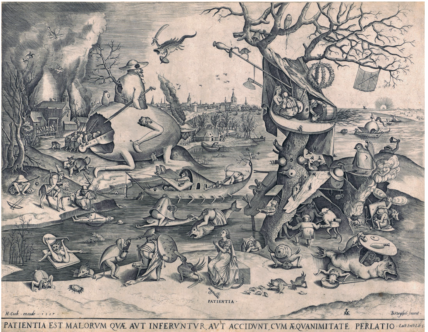
Abb. 16: PIETER VAN DER HEYDEN, Patientia. Kupferstich, 1557 (Amsterdam, Rijksmuseum, RP-P-1878-A-2827).

zutreffend (es fehlen genaue Angaben zu Präsenz/Fehlen der Grillen und zum unterschiedlichen Haarvolumen der Frau; Abb. 26/1 entspricht nicht 26/1 „as described“; Variante 26/II „with the number 3“ existiert nicht; die Inv. Nr des Louvre ist 7926 LR; 26/III ist nur bei NAGLER 2180, 3-7: B. 16 und zweifelhaft; 26/V Nürnberg ist eine 26/II).