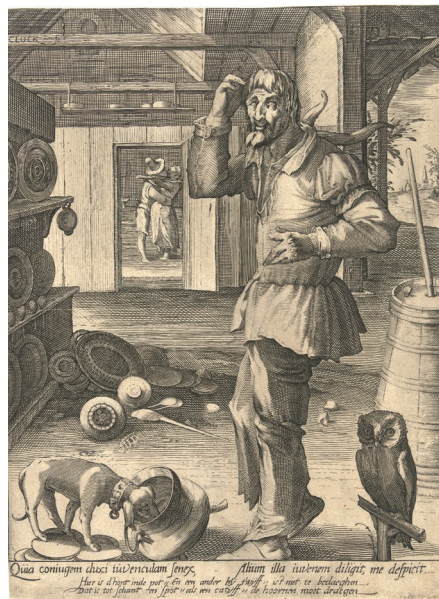
Abb. 11: NICOLAES JANSZ CLOCK, Der Hornträger oder der betrogene Ehemann. Kupferstich, um 1591/1602 (Amsterdam, Rijksmuseum, RP-P-BI-5900).

Semiotik und Ikonographie erklären nun auch eine weitere Eulendarstellung auf einem Stich von NICOLAES JANSZ CLOCK (Leiden um 1576-nach 1602), der ebenfalls den Hahnrei verspottet. 52 Er zeigt einen älteren Bauern, der soeben von der Arbeit zurückgekehrt in der Diele steht und sich am Kopf kratzt (Abb. 11). Auf seinem Rücken hat er zwei große Hörner. Er erwartet das Essen auf dem Tisch zu finden, doch stattdessen sieht er den Hund, der die letzten Reste vom Essen auffrisst. Geschirr und Küchenzeug liegen am Boden. Die bekannte niederländische Redewendung „den Hund im Topf finden“ für das Zuspätkommen 53 bekommt hier einen doppeldeutigen Sinn, denn der Bauer kommt nicht nur zum Essen zu spät. Durch eine Tür sieht man in das Nebenzimmer, wo seine junge Ehefrau einen jungen Liebhaber umarmt und küsst. Darauf spielen nun die Sinnsprüche in Latein und Altniederländisch an. „Quia coniugem duxi iuvenulam senex, Alium illa iuvenem diligit, me despicit“ und „Hier is d’hont inde pot / Een en ander by twyff / ist niet te beclaegen / Dat ic tot schnat en spot / als een