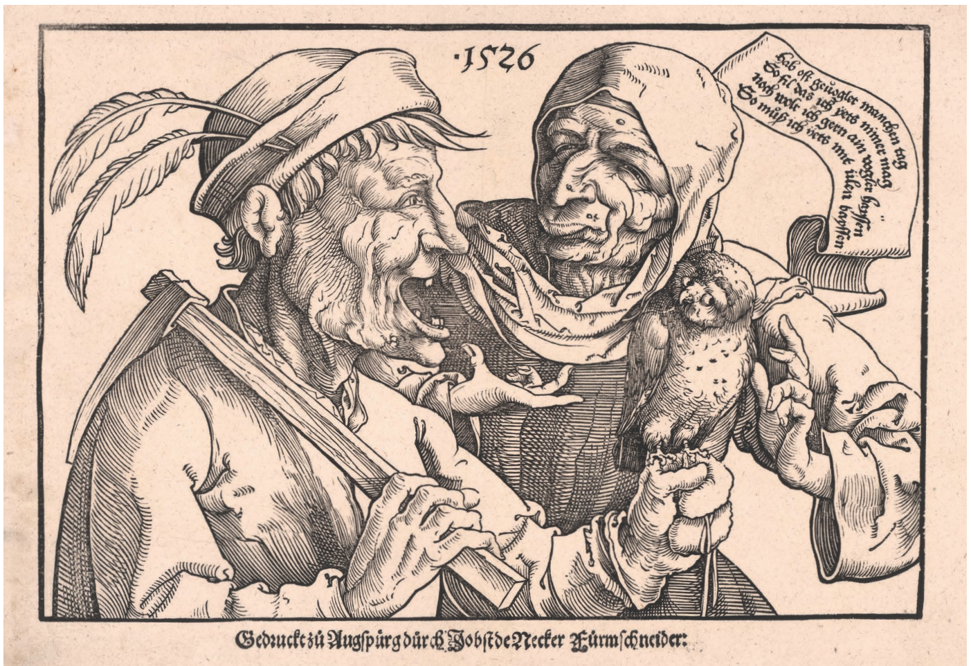
Abb. 2: CHRISTOPH AMBERGER, Zwiegespräch eines Bauernpaares. Holzschnitt, 1526 (Gotha, Schlossmuseum Schloss Friedenstein, Kupferstichsammlung 40,11/826).

1568. 9 Vielleicht ist dies auch eine Erklärung für das Käuzchen als lebende Helmzier in einer Radierung vom Meister des Hausbuchs (tätig zwischen 1470 und 1505 im Rheinpfalz und am Mittelrhein), die eine junge Schönheit mit Wappenschild und Turnierhelm zeigt. 10 Weitere Pendants zu diesem Motiv desselben Meisters zeigen nämlich klassische Parodien (Spinnerin, Frauendominanz) in bäuerlichem Habitus. Es liegt also nahe, dass es sich nicht zwangsläufig um ein heraldisches Element handeln muss.